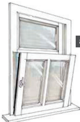
8 Kiepstand onderraam