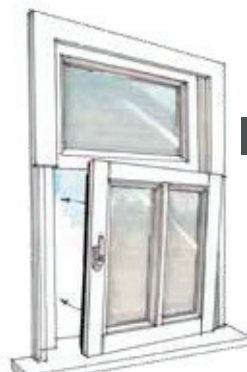
6 Monteren nieuw bovenraam met inhaakkozijn