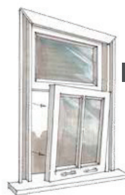
3 Demonteren onderraam