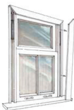
2 Demonteren belegdeel