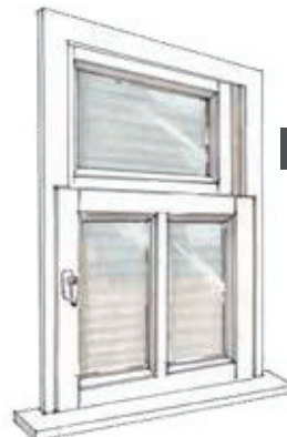
9 Gesloten stand