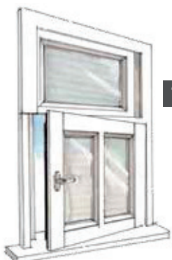
7 Draaistand onderraam