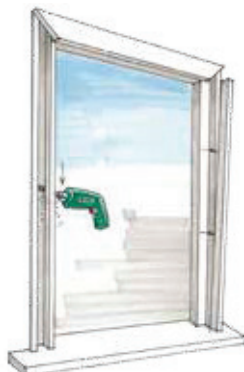
5 Uitzagen kozijn