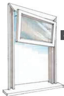
4 Demonteren raam