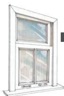
1 Bestaand kozijn